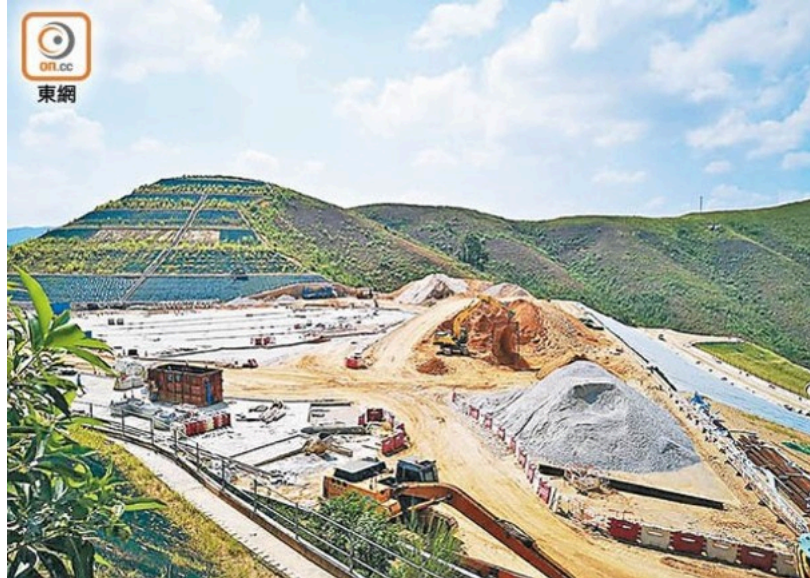
有團體推算，單是沙嶺數據園區估計年耗電量已達約17.5億度。

本港數據中心數目急速增加，用電需求顯著上升。全球多地目前已制定數據中心電力使用效率(PUE)標準，惟本港仍未訂定PUE上限等規管措施。有環保團體推算，單是沙嶺數據園區估計年耗電量已達約17.5億度，相等於全港用電量約3.8%，足夠64萬戶三人家庭全年用電，成為本港一大耗電用戶。團體敦促政府與國家及世界接軌，及早更新政策，確保2050年前實現碳中和的目標不受影響。