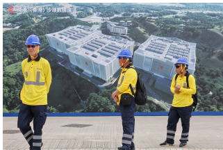
Staff on duty during the groundbreaking ceremony for the Range (Hong Kong) Sandy Ridge data facility cluster.

“With a PUE cap, there is motivation [for data centres] to change their energy conservation measures,” Chan said.