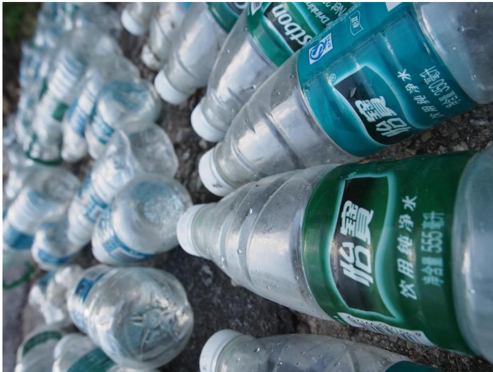
2018年7月25日 港島垃圾灣

數據顯示，簡體字品牌膠樽佔 46% (5,044 個)，較繁體膠樽(4,346 個)40%多六個百分點，餘下 14% (1470 個)的膠樽為中文以外的品牌。若以瓶上文字判斷廢物來源，則本地與香港以外分佔 40%及 60%，與環保署《 香港海上垃圾的源頭及去向調查 》所指只有 5%源自香港以外的比例，相去甚遠。