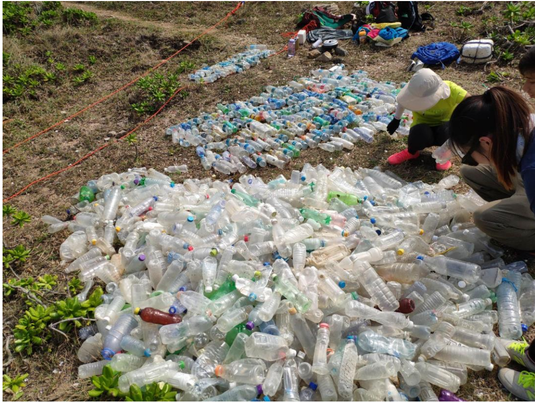
2018年10月28日 東龍洲，清出大量招紙脫落膠樽。東龍洲颱風善後義工組