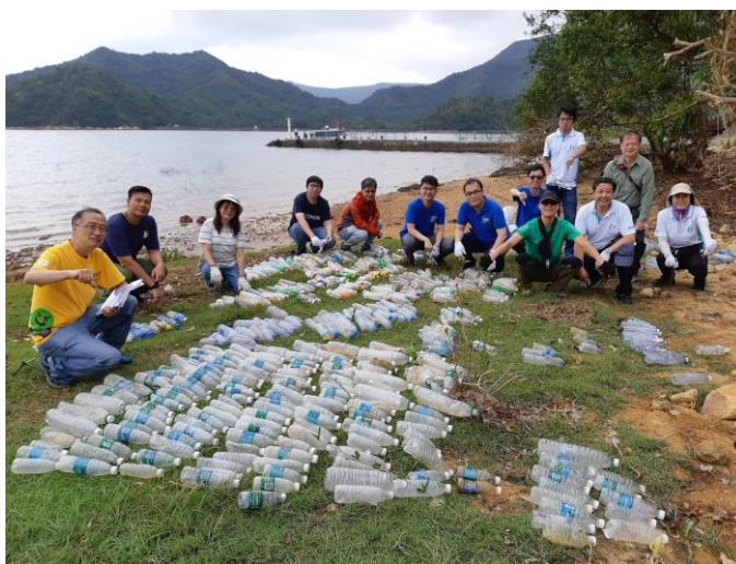
上圖：2018 年 10 月 14 日荔枝窩