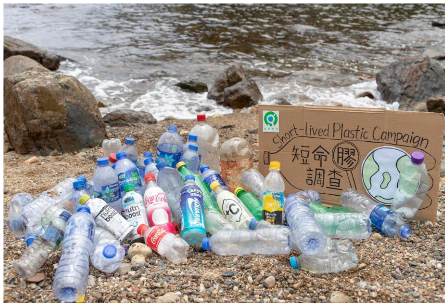
2018年9月14日西貢小棕林撿到的可樂系列膠樽

可口可樂這個全球最大的飲品品牌，產出的廢膠樽數量不容忽視。在繁體品牌中，可樂系列膠樽與排名第一的維他系列叮噹馬頭；若計入簡體及其他文字的可樂產品，則反壓過維他，僅次於怡寶。