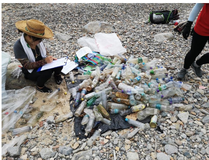
下圖：2018 年 7 月 7 日南丫島白鴿坑，參與團體：搞乜東東