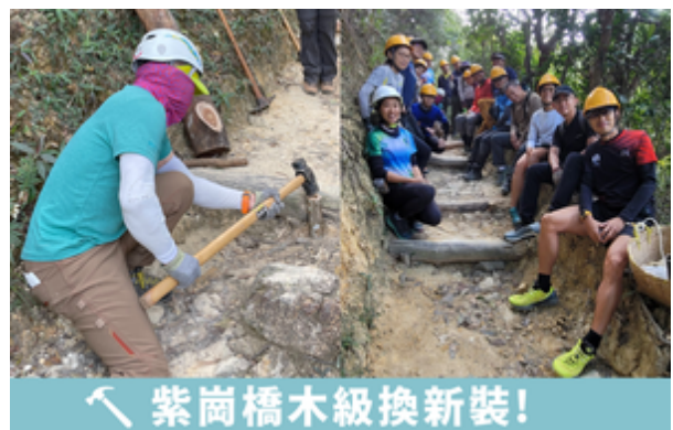
紫崗橋木級換新裝！