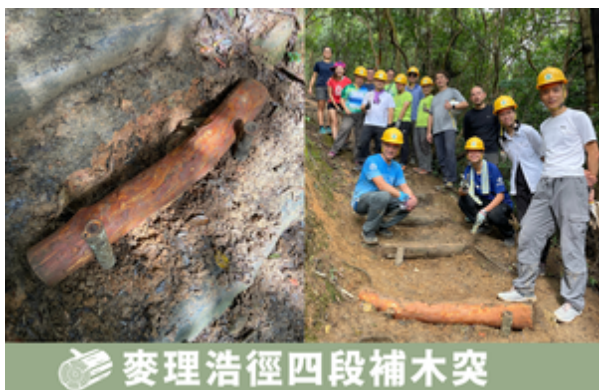
麥理浩徑四段補木突

「手作步道」利用天然材料修復山徑，定期保養是很重要的。今年初，我們的「自己山徑自己修」義工隊就回到淺水灣坳和麥理浩徑第四段跟進在2018及2019年以手作步道方式修築的山徑，替它們更換腐化的木級及木釘。幾年前參與修建山徑的義工亦見證山徑的變化，也履行那時候許下「永久保養」的 復修承諾 ！