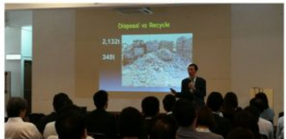
畢馬威會計師事務所、太古地產