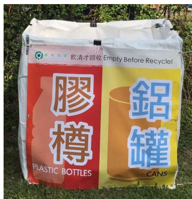
附圖二 回收桶樣式